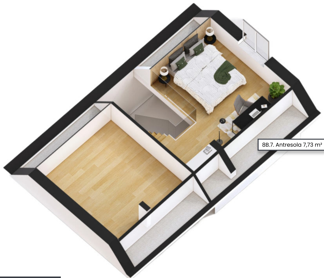
8B.7. Antresola 7,73 m 2